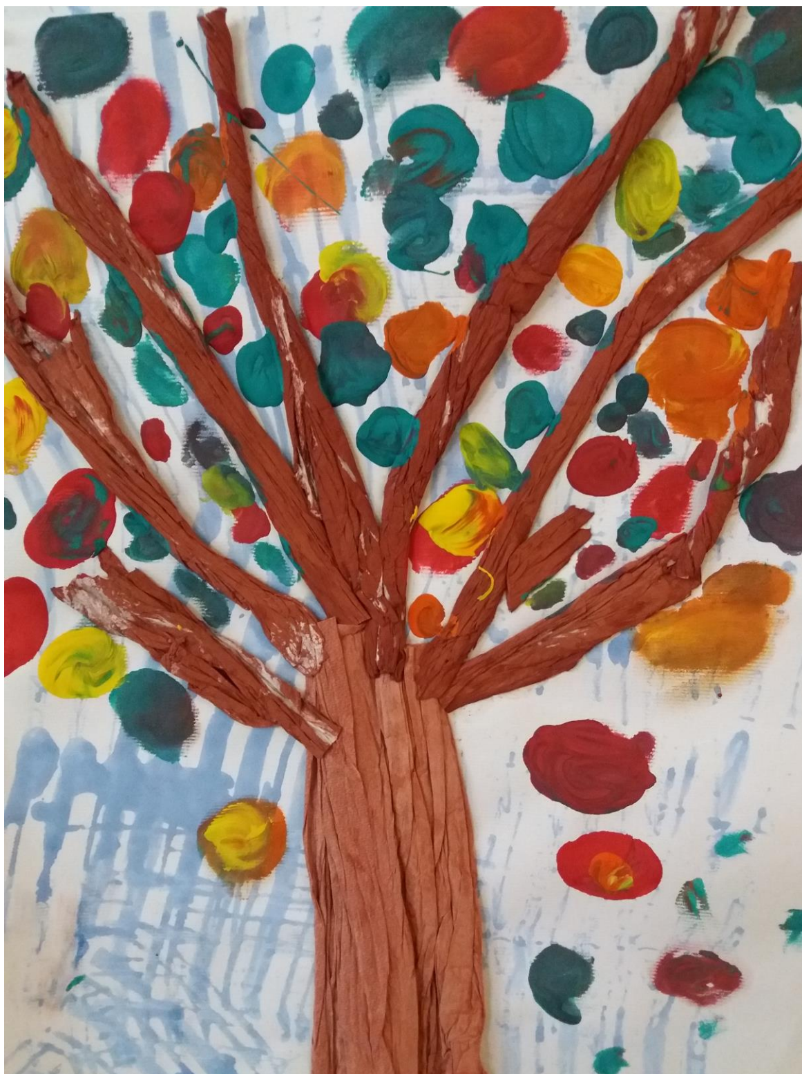
Likovni prispevki: otroci Vrtca Prebold Vsebina: Mateja Matko, pom. ravnatelj za vrtec, Lidija Selič, dipl. vzg. pred. otrok Oblikovanje in urejanje: Lidija Selič, dipl. vzg. pred. otrok